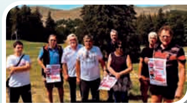
Les Médailleurs de la Lozère en préparation du TCFIA.