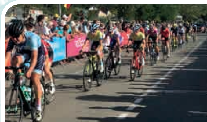
Le sprint d'arrivée du peloton à Ruoms (Ardèche).