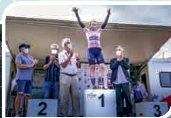
Remise du maillot rose à Ruoms (Ardèche) par les Présidents du CDOS et des Médailleurs JSEA du Gard.