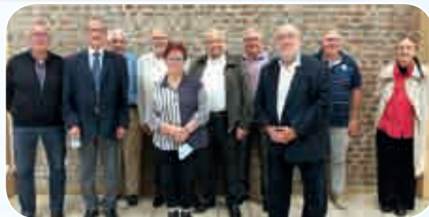
Les dirigeants des Hauts de France.