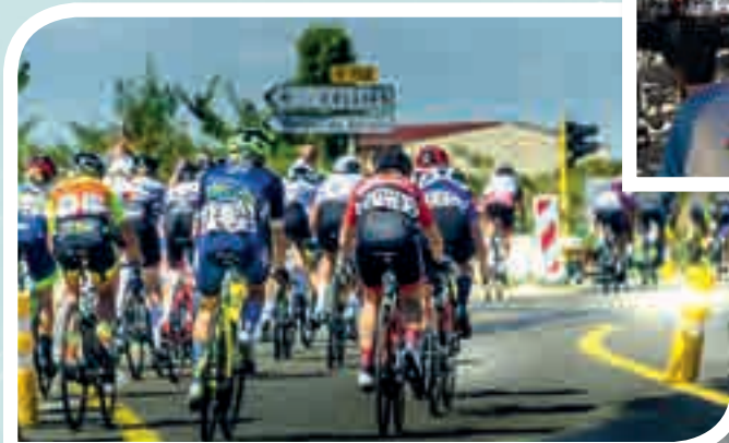
Au cœur du peloton.