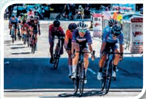
Victoire de la 2 ème étape de la Championne de France Audrey Cordon-Ragot.