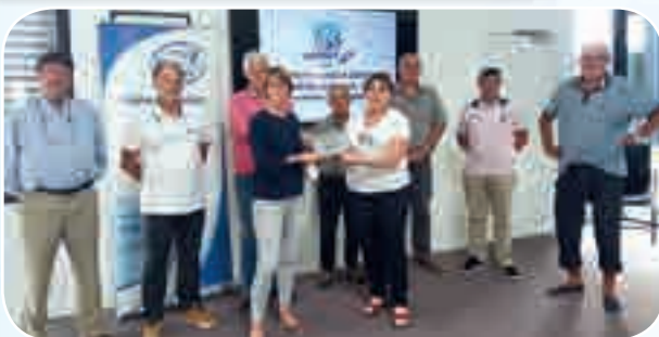
La Présidente remercie la secrétaire de mairie de Lanildut pour son accueil et la mise à disposition de la salle pour cette séance de cours.