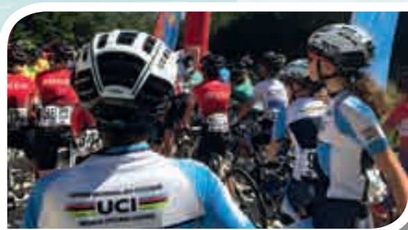
Les championnes internationales sur la ligne de départ.